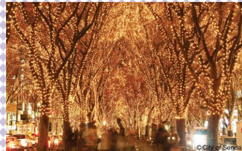
光のページェント